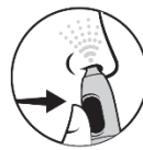
4. Paina annospainikett a