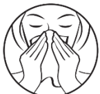
1. Niistä nenä