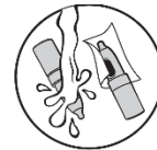
5. Puhdista ja kuivaa