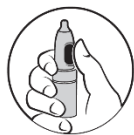
2. Tummen på knappen