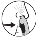
4. Tryck på knappen