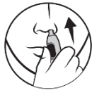
3. För in i näsan