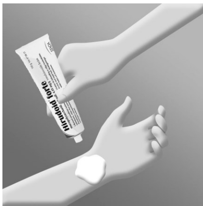
Applicera emulsionskräm på handleden.