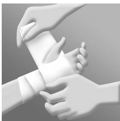
Bind in handleden med ett elastiskt förband först i riktning mot handflatan. Linda förbandet runt tummen och sedan över handflatan och klipp ett hål i förbandet för tummen på följande varv.