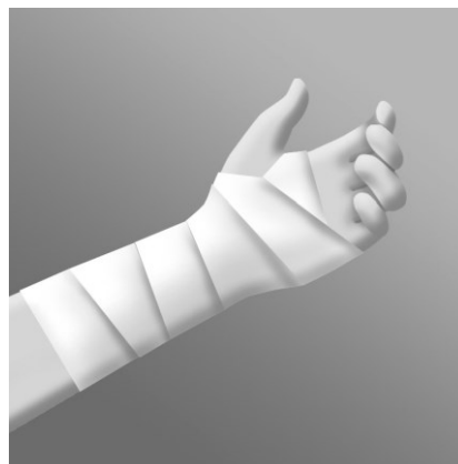
Vira förbandet längs armen, upp över handleden och fäst det. Byt förbandet två gånger om dagen, om inte läkaren föreskriver annat.