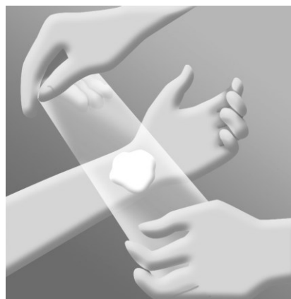
Linda ett varv plastfolie runt handleden så att krämen täcks.